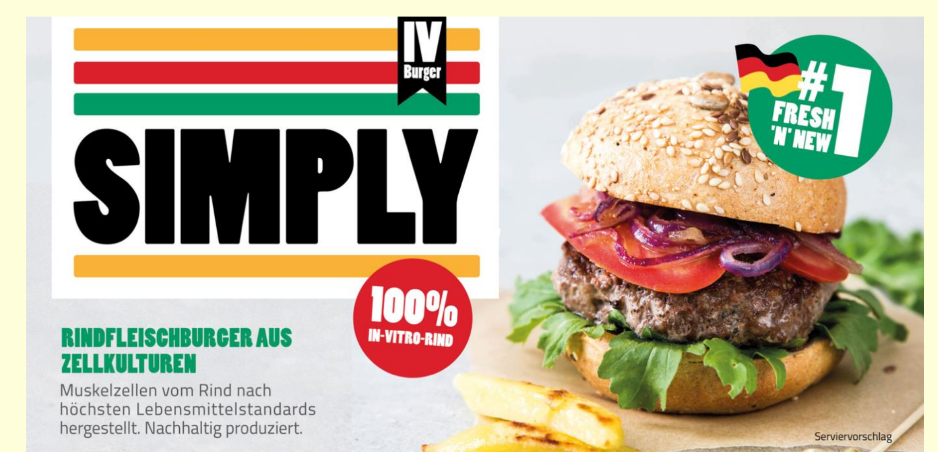
Verpackung eines kultivierten Rindfleischburgers aus Zellkulturen – Utopie oder Realität?

Jetzt sollen wir auch noch Insekten essen?!? Wenn Sie mehr darüber erfahren möchten, ob man durch Biologieunterricht die Akzeptanz von Jugendlichen steigern kann, Insekten als Nahrungsmittel zu nutzen, dann schauen Sie hier nach.