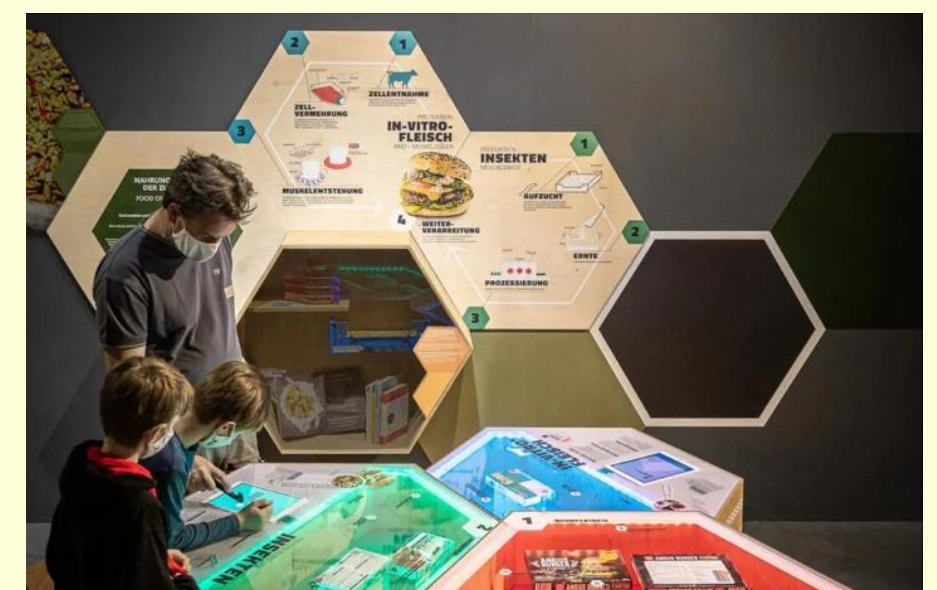
Interaktives Exponat zum Vergleich der Nachhaltigkeit von Rindfleisch, Kultiviertem Fleisch und insektenbasierten Nahrungsmitteln in einem Museum

Sie möchten mehr über unsere Arbeit im Bereich der Wissenschaftskommunikation wissen?